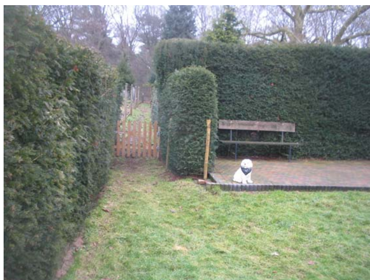
paadje achter het huis richting Duitsland

Vrijbankvlees was ook regelmatig verkrijgbaar bij slagerij Wolters te Maria Hoop.